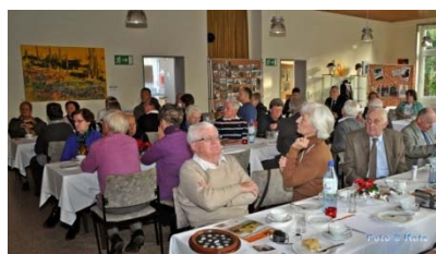
...und bei Kaffee und Kuchen und guten Gesprächen.