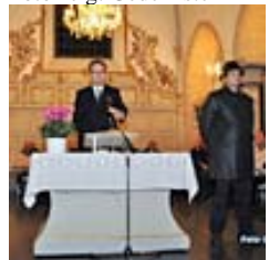
Foto zeigt Dr. Günther Krings (MdB) bei der Ansprache in der Kirche

Die Ansprache zur Kranzniederlegung hielt Dr. Günther Krings in der Kirche. Er schlug einen thematischen Bogen der Kriegsoffer von der Völkerschlacht bei Leipzig vor 200 Jahren bis zu den jüngsten deutschen Opfern im Afghanistan-Krieg. Dabei betonte Dr. Krings die Verantwortung von allen Bürgern beim weiteren Zusammenwachsen der europäischen Staaten als wichtigste Grundlage zukünftiger Friedenssicherung.