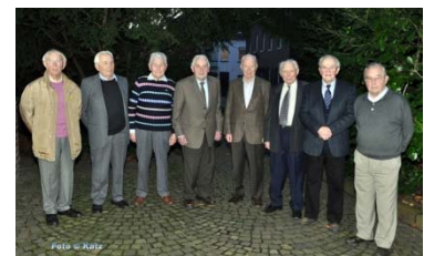
Gruppenfoto der Ehemaligen (siehe großes Foto auf der n. Seite)