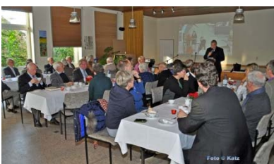
Foto zeigt Gäste beim Ehemaligentreffen im Gemeindehaus.....