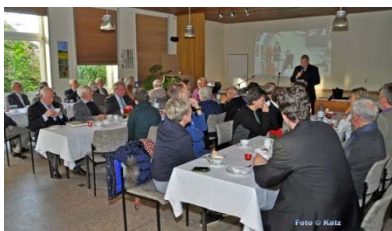
Foto zeigt Gäste beim Ehemaligentreffen im Gemeindehaus.....