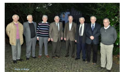
Gruppenfoto der Ehemaligen (siehe großes Foto auf der n. Seite)