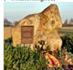
Foto zeigt Gedenkstein

Nach dem gemeinsamen Besuch des Lager-Gedenksteins am Hochneukircher Weg folgte die Feierstunde anlässlich des Volkstrauertages , die mit dem Marsch vom Bresser-Platz zur Kirche begann und traditionell wieder von allen Dorfvereinen getragen wurde.