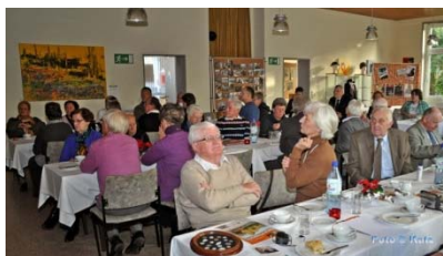
...und bei Kaffee und Kuchen und guten Gesprächen.