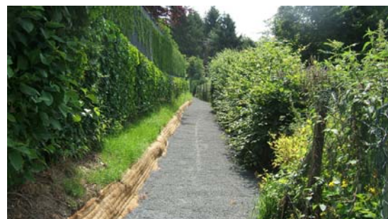
Nach der Renovierung